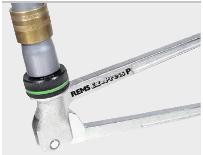
Kvalitní německý výrobek

Např. aquatherm, General Fittings, IVT, REHAU, REVEL, ROTEX, Seppelfricke, TECE, Würth