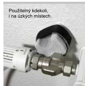
Kvalitní německý výrobek