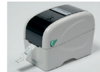
Etikettendrucker und Etikett

Mit dem HÜRNER -Verfahrstaster an der Basismaschine lässt diese sich verfahren, wenn der Schweißer neben ihr steht. Der Schweißprozess wird bequemer, weil man nicht immer wieder zwischen Hydraulikcontroller und Schweißstelle pendelt.